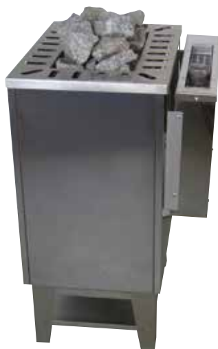
W 10 установленный на S 33