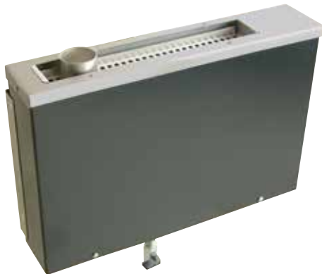
W 10 Мощность 1,5 кВт Антрацитовая эмаль