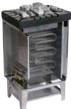
Внутреннее исполнение печей SAUNA-therm.