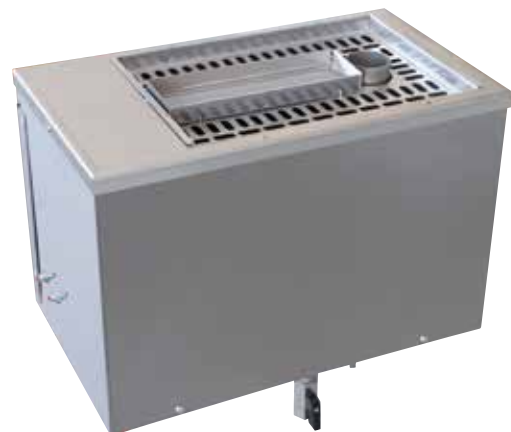
W 20 Мощность 3 кВт