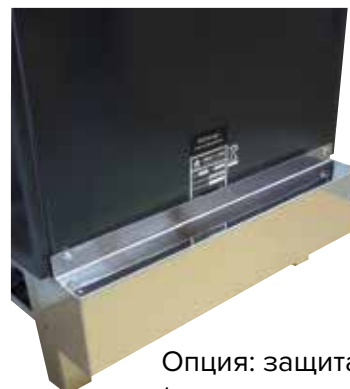
Опция: защита кабеля (монтируется на задней стенке).