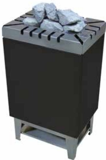
Тип 33 Мощность 4-9 кВт