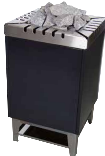
Тип 44 Мощность 10-15 кВт