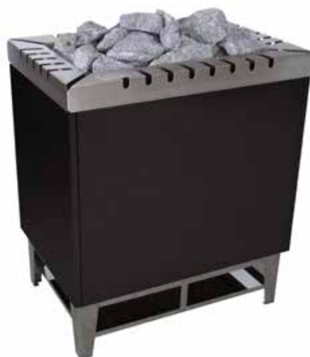
Тип 64 Мощность 18-21 кВт.