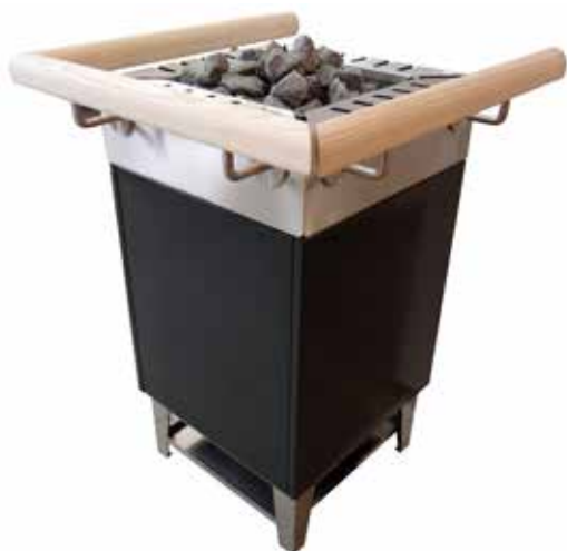
GSK 44 с поручнями Мощность 6-15 кВт