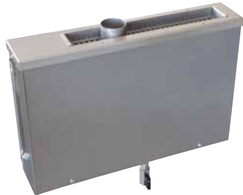
W 10 Мощность 1,5 кВт Нержавеющая сталь