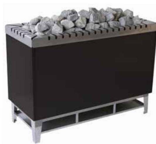
Тип 104 Мощность 32-36 кВт