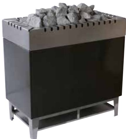
Тип 84-GSK Мощность 24-30 кВт